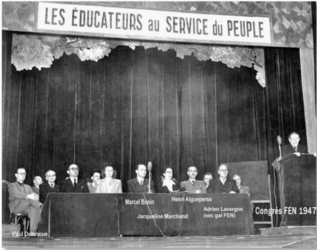
Revalorisation de la condition des enseignants éducateurs au service du Peuple